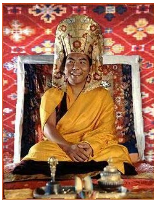
འཇམ་མགོན་ལྷོ་གོས་ཚོས་གྱི་སེང་གེ།