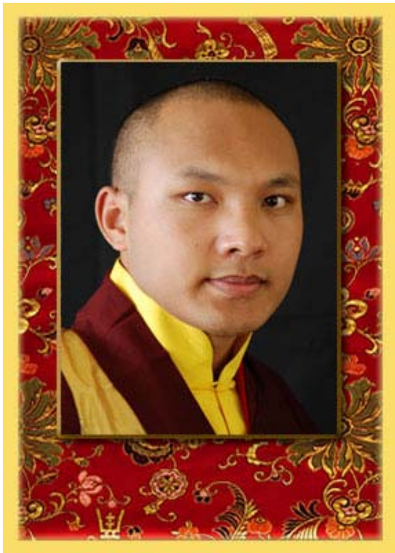
O Décimo-Sétimo Karmapa, Ugyen Trinley Dorje (1985- )